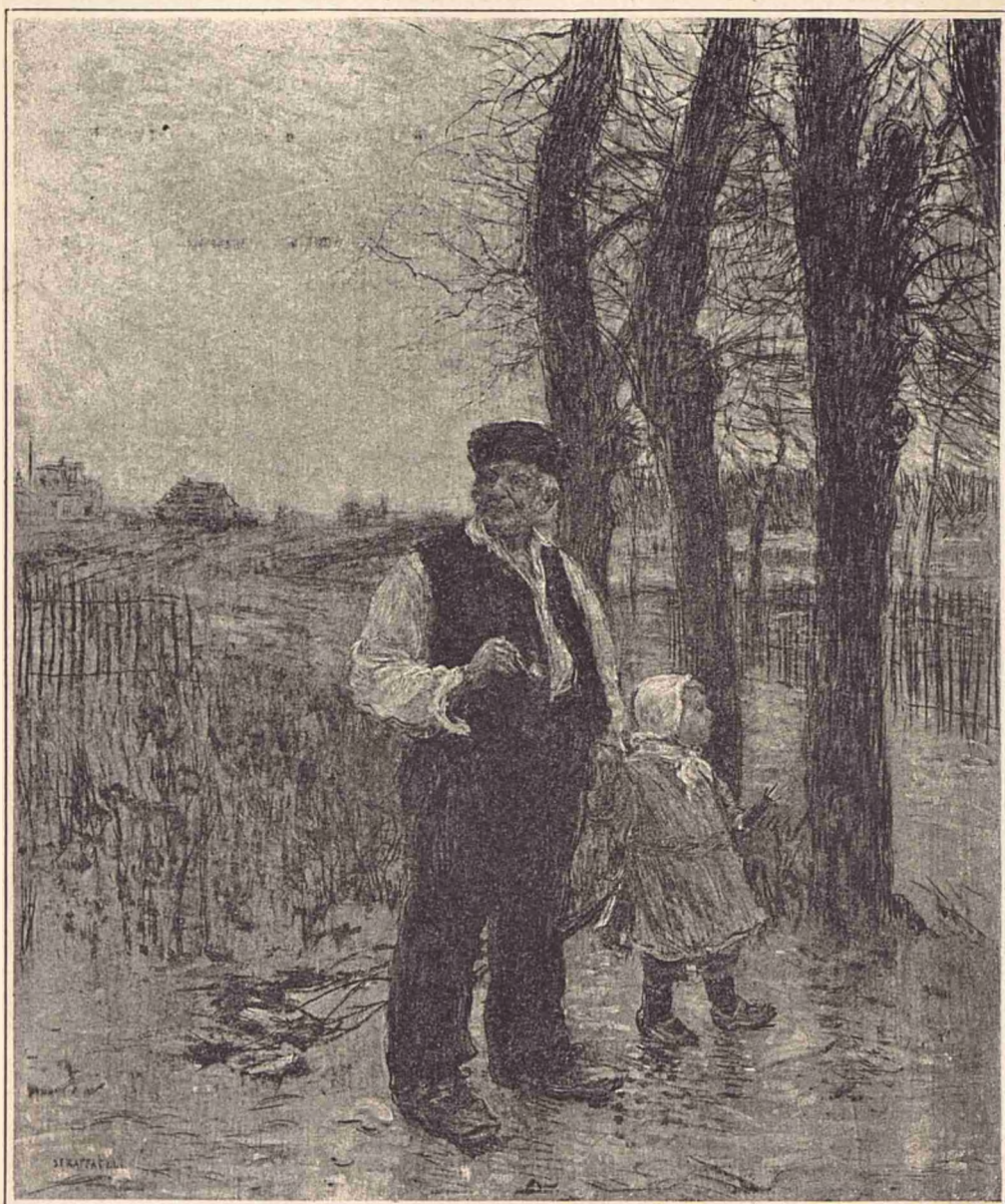
Plimbarea cu buniceul.