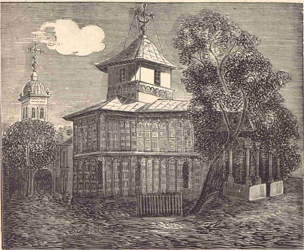
Biserica Mihaiu-Vodă din Bucuresei.

B iserica acésta, ca și Mitropolia și Radu-Vodă, despre cari am vorbit în acésta revistă, se află situată pe una din cele mai frumoase pozițiuni ale Bucureștilor. Ea e întemeiată de Mihaiu Vitezul în anul 1594. Durere însă, că aproape singurul monument ce posedăm de la unul din cei mai mari viteji ai némului românesc, se află în