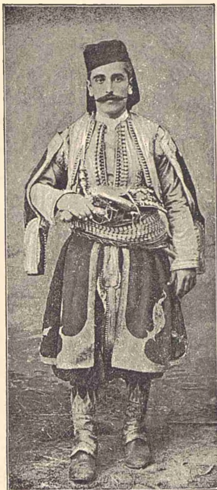
Albanez în haine de sărbătoare.

trebuie să fie un om de onoare. El trebuie să știe a respecta amicitia și ospitalitatea și a nu rupe cuvântul de credință. Trădarea și lașitatea sînt considerate de Albanez ca păcatele cele mai josnice. După ce un copil ajunge ado-