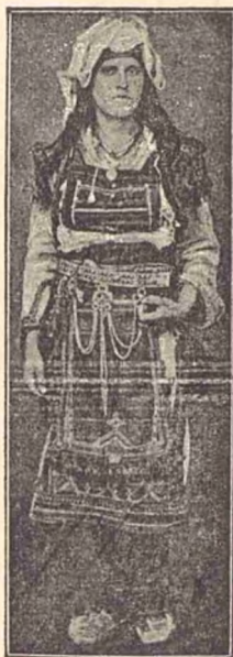
Tipuri de Albaneze.