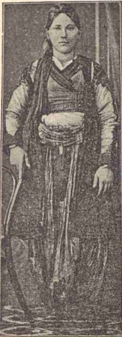
Albaneză catolică de pe lingă Scutarí.

Iliria fu supusă definitiv prin vécul al doilea înainte de Christos de către Romani; aceiași sórtă o avu și Epirul.