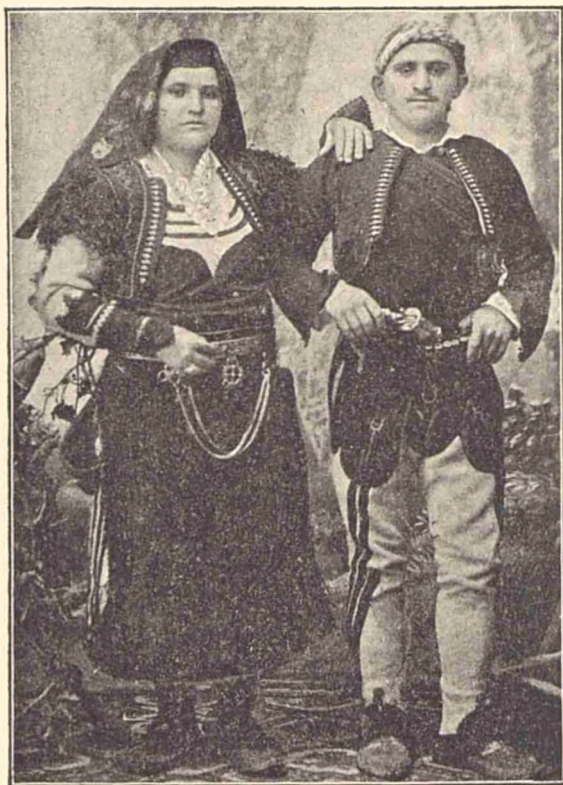
Țărani albanezi catolici.

Albanezului cercetază cum a primit el mórtea. Când glonțul este primit în spate, acesta dovedesce că el nu a apărat îndestul pe óspe și fapta lui e desaprobată, iar memoria disprețuită. Dacă însă glonțul a fost primit în piept, atunci familia ucisului urmăresce pe omorîtor, mai ales pentru a răzună sângele óspelui.