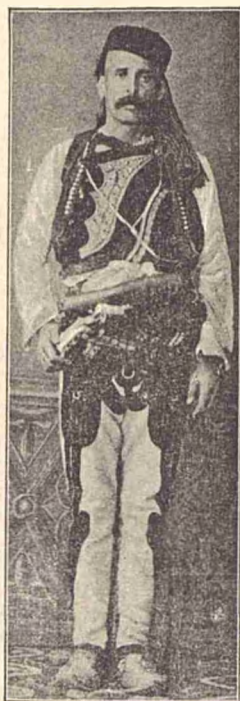
TIPURI DE ALBANEZI.

care îndemná pe tineri la vitejie și arată că Dumnezeu a făcut pe om pentru ca să se lupte, pentru ca să apere onórea sa și pe a celor slabi, pentru ca să-și ție cuvîntul dat și pentru ca să respecte amicitia și ospitalitatea.