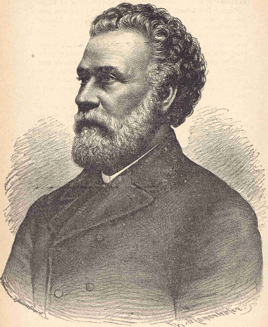
Ion C. Brătianu.