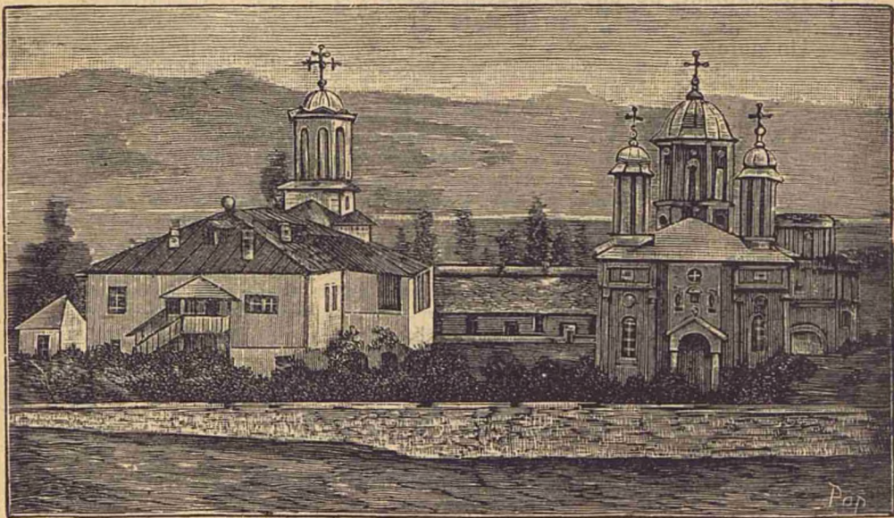
Catedrala și Palatul Episcopal din Râmnicul-Vîlcea.

Pînă acum P. S. Sa a publicat următoarele scrieri: 1. Memorii asupra facultății de teologie; 2. Manual de teologia morală; 3. O călătorie în Orient; 4. Etica evoluționistă și Morala creștină; 5. Mai multe studii publicate în revista «Biserica Ortodoxă Română.»