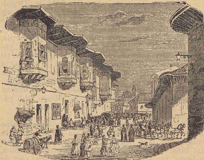
Podul Mogoșoii din Bueuresei pe la 1830