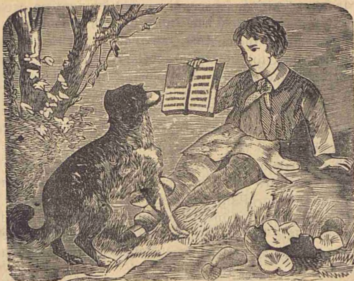
O lecție de citire.