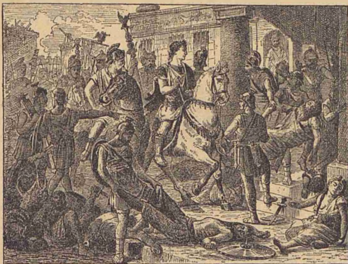
Intrarea lui Traian în Sarmisegetuza.

Ei nu credeau numai într'un D-deu, ci în mai mulți și de ôre-ce se socotiau nemuritori, nu se temeau de mörte, ba chiar o doriau; numai așa se pôte explica curajul cel peste măsură de mare, pe care îl desfășurau în rêsboi.