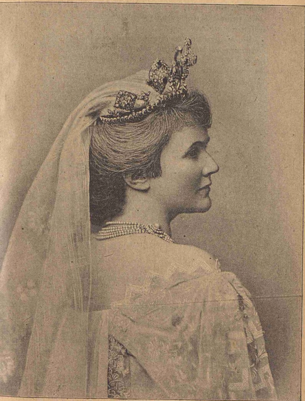
M. S. Regina Elisabeta.