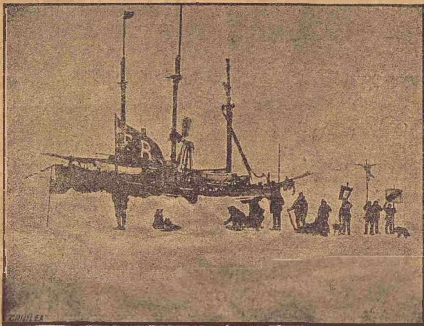
Aniversarea zilei de 17 Maiu.

De multe ori însă trecură și ei prin emoțiuni nu tocmăi plăcute, căci corabia întîmpină apăsări gróznice din partea