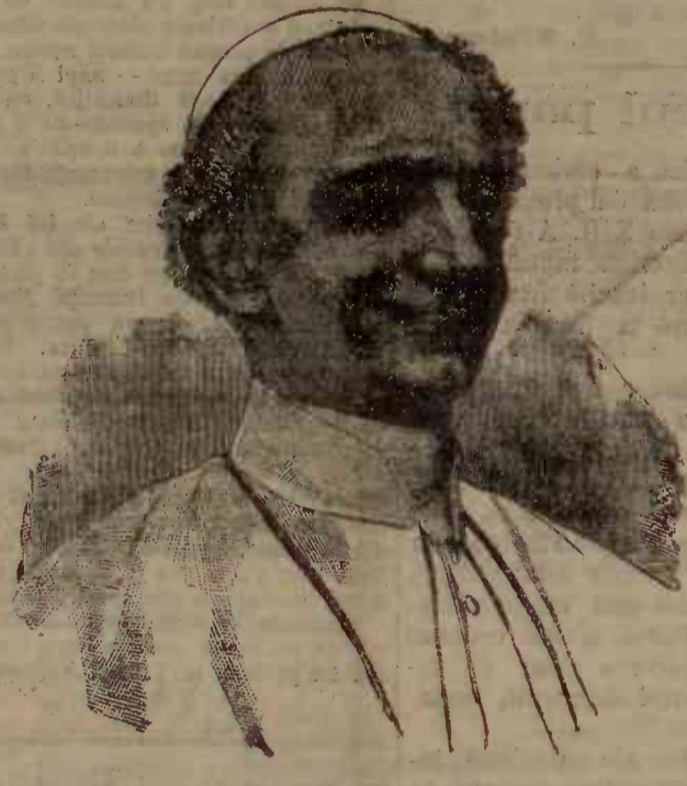
— Vezi articolul «Jubileul papei» —