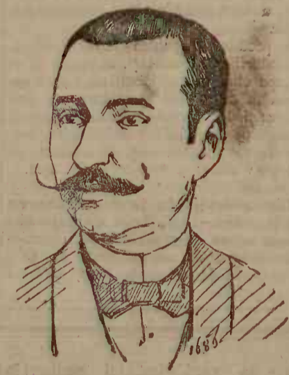
Martorul regretatului Lahovary în duelul ce l-a avut cu d. N. Filipescu...