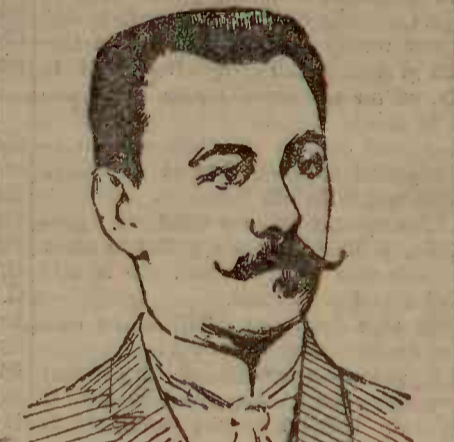
Principalul acuzat în procesul de astăzi acela asupra căruia cade sarcina morfelor contractului nostru de la L'Independance Roumaine.