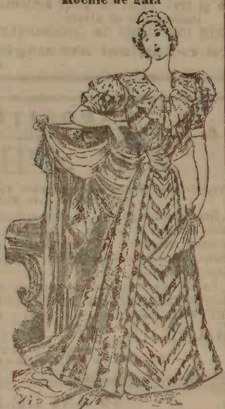
Rochie de gală

Mica publicitate este cel mai eficient mijloc de reclamă. Un anunț de 4 linii cuprinzând 100 litere, numai 50 bani