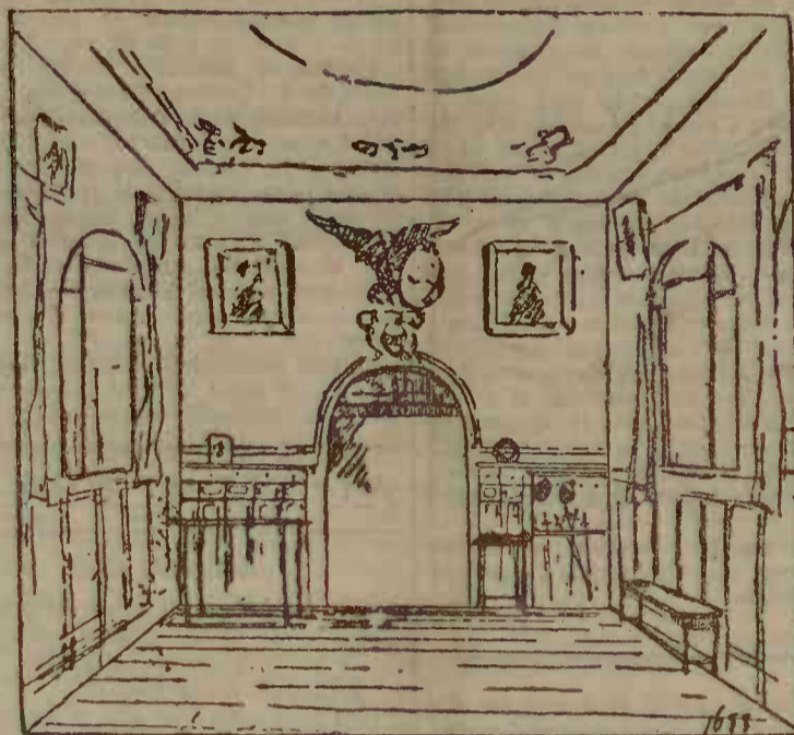
Sala de la Societatea de gimnastică unde a avut loc duelul