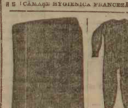
FUSTĂ DE DAMA