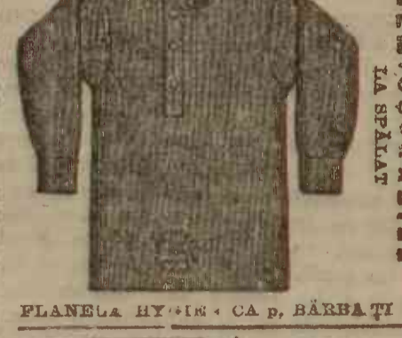
PLANELA HYGIENICĂ CA P. BĂRBAȚI

Țesatura Hygienică franceză e fibre de Turba care după multe încercări D-rul Rasurel a reușit a realiza, posedă de la sine o putere enormă de absorbere și de evaporizațiune, ast-fel că îmbrăcăt cu aceasta îmbrăcămintea de Vata de Turba răcelii nu sînt posibile, mai mult încă virtutina cea mărs antisepică a Turbei nimicește toate polterizațiunile microbice formate din cauza transpirațiunii, Țesatura Hygie- nică franceză a D-rului Rasurel poate fi considerată ca un progres imens și toată lumea pentru a evita răcelii și ori-ce boli ar trebui să poarte această îmbrăcămintea.