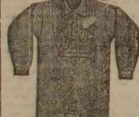
HE ÎCAMARE HYGIENICA FRANCEZĂ