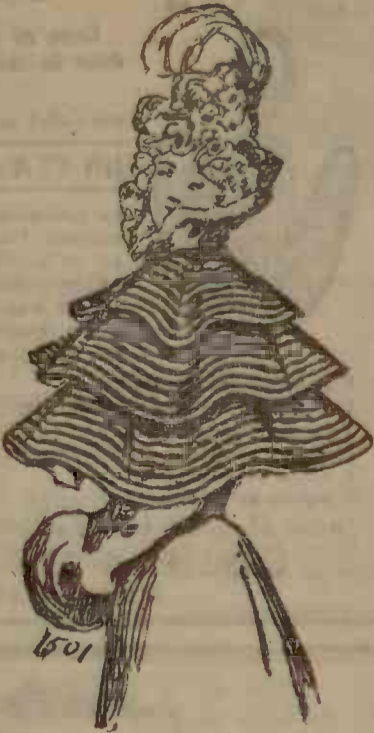
Se compune dintr'un triplu volan de velur, cercuit cu panglică neagră. Guler de chinchina, dublură de satin crem.

Adormisem și odată cu somnul și razele lunii dispărură din fața ochilor mei. A doua seară mai așteptam ca luna să-mi vorbească, dar erau nori și un vînt rece de Decembrie urla prin coșuri. Părea un glas de urias care povestește lucruri înfiorătoare și care te face să îngheți de frică. Nu mai era glasul blînd al frumosei și diafane lumini, care strălucea, luminînd prin boschete calea iubitorilor.