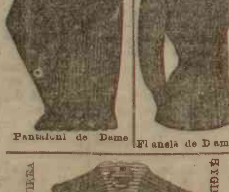
Pantalonii de Damă