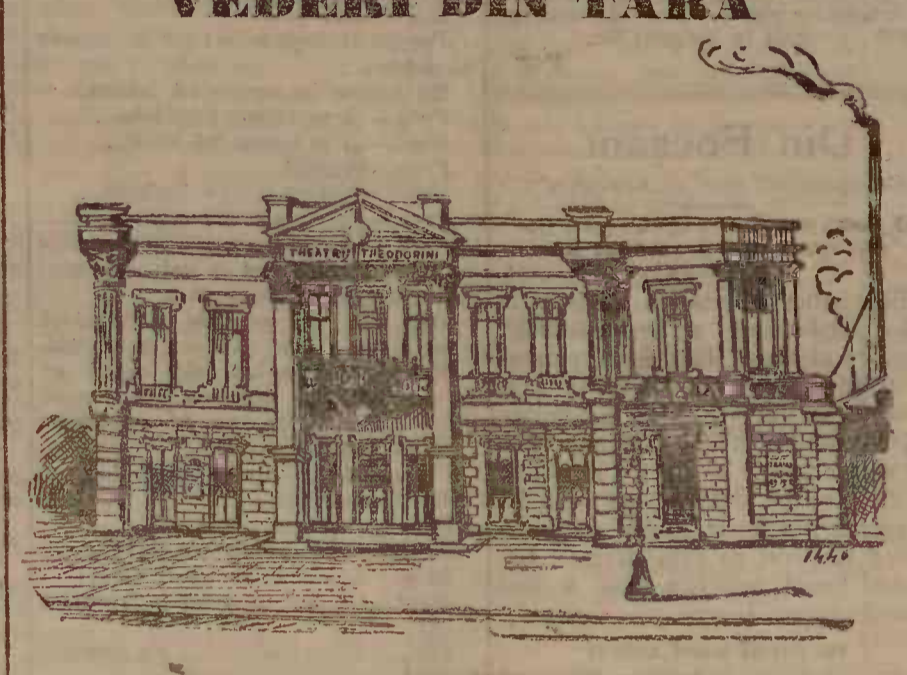
TEATRUL THEODORINI DIN CRAIOVA