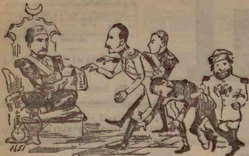
Abdul-Hamid stă cu Keferul pe... tron și întinde beratele. Ferdinand al Bulgariei și Alexandru al Serbiei au pus mâna pe câte-va din ele—dar când se gătea și musin Carol al nostru să înghite un berat, Maladeaf de la Nord îi pune o piedică și în loc de berat s'a ales cu... rahat.