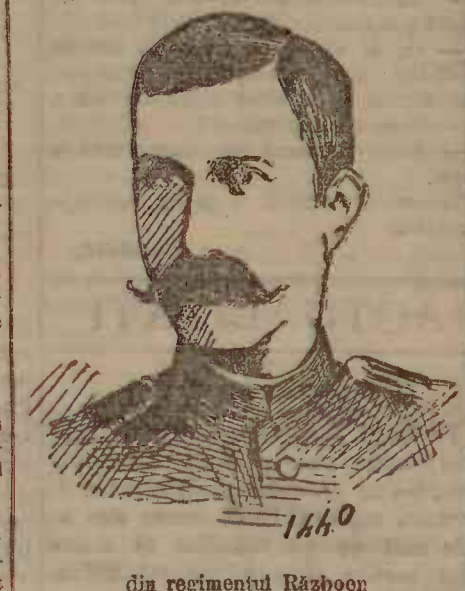
din regimentul Războeni

Geandarmieria rurală S'a vestit prin ziare despre lupta geandarmilor rurali cu banditul Pieleverde, luptă întimplată în comuna Brăești, județul Iași.