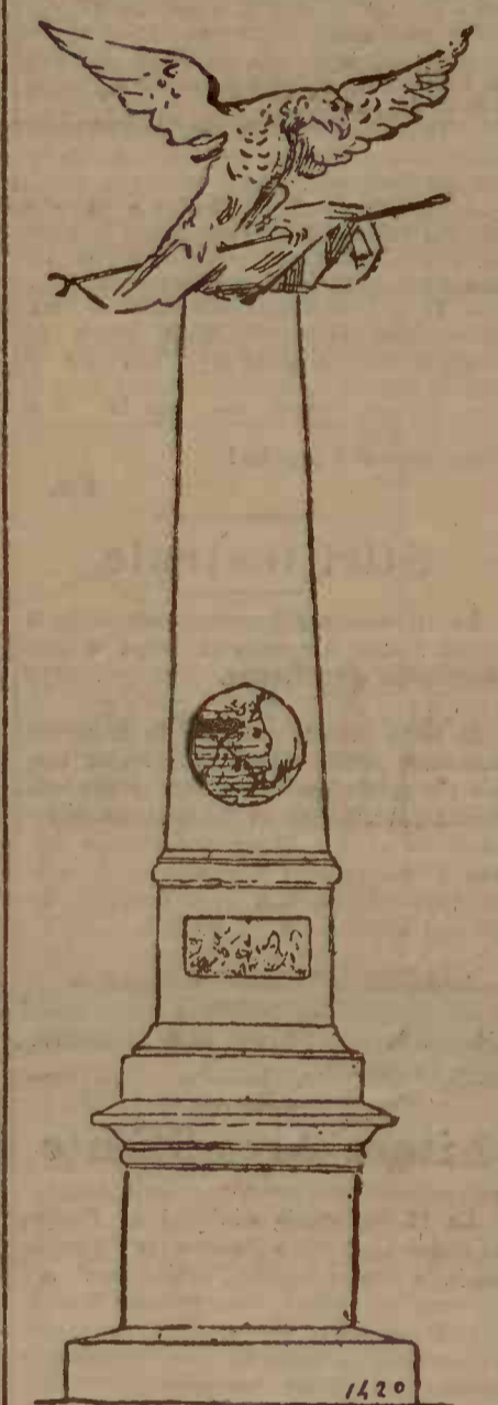
Șchiță făcută după planurile puse la dispozițiunea noastră de d-l Hegel.

A se vedea în corpul ziarului amănunte foarte interesante din articolul de reportaj: „Decorarea lui Iesszenszky în Camera maghiară”.