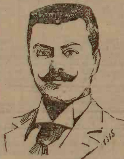
— Vezi col. VI-a —