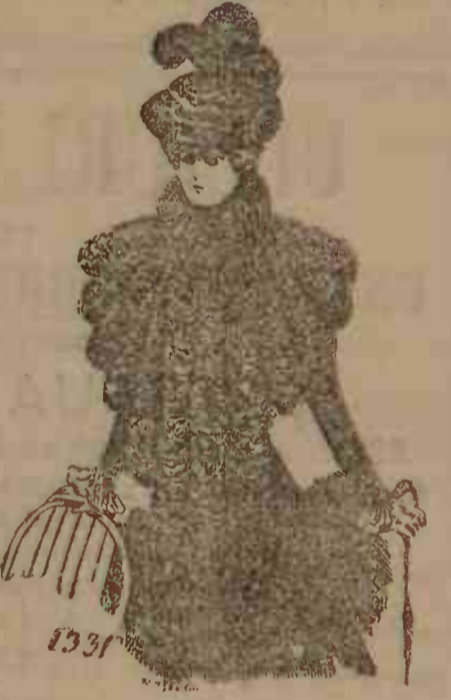
Un guler din marabout și pone de struț. Se face mai ales în gris și alb, și de tot în alb.