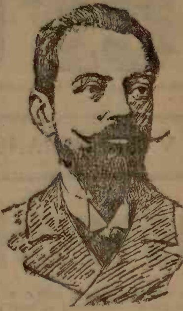
Al Provență soare cald... Așa leme le-ai uitat!, etc.