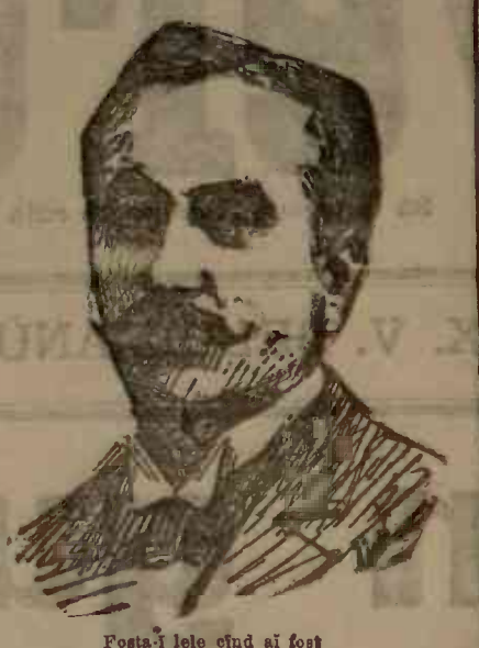
Posta-l este cînd ai fost Dar acum....

A avut trecere mare odată la cucoane. Cînta, don'te, de rupea pămîntului.