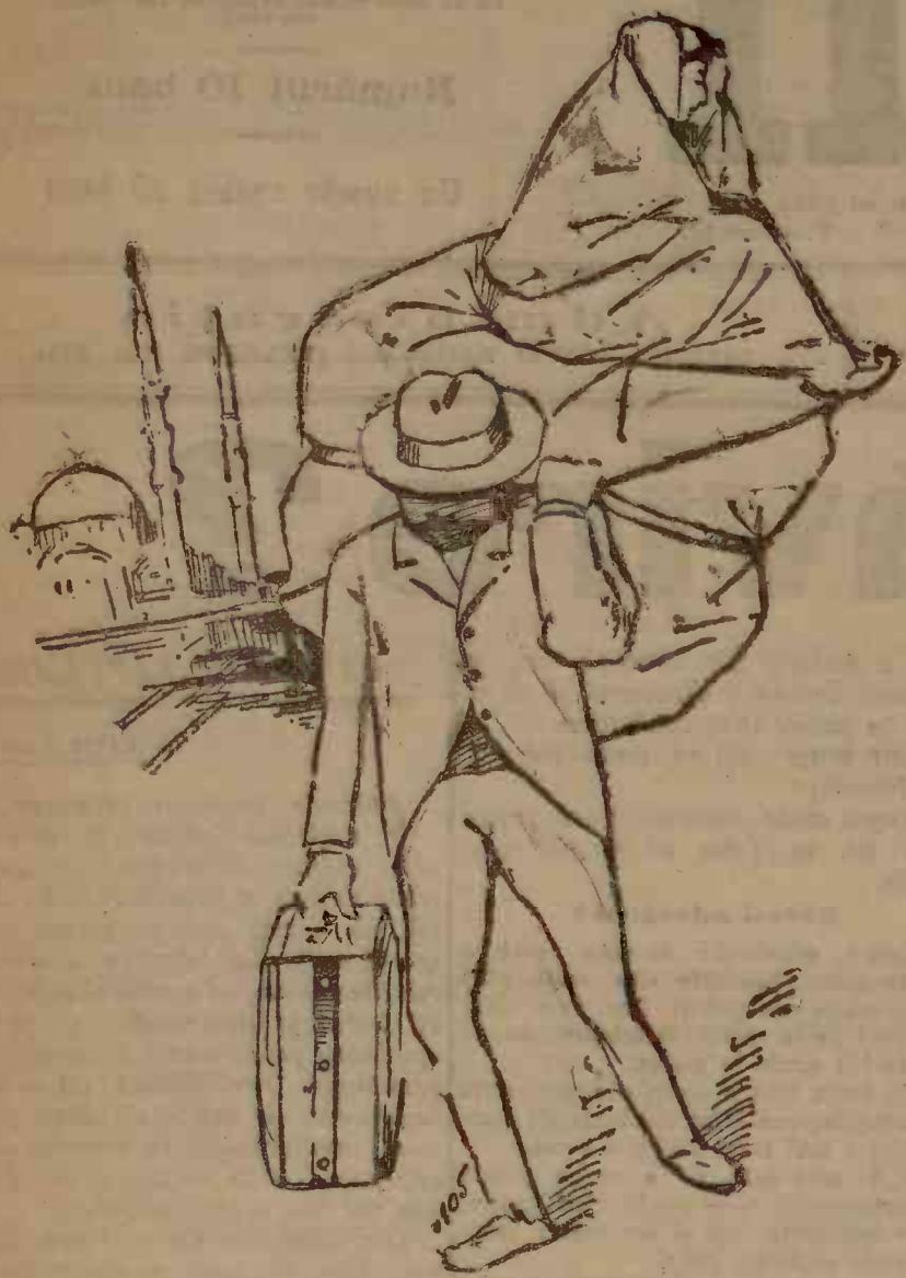
Mai greu tmi pare drumul, acum la ntors acas Cadina din spinare, ce greu, ce greu m'apas!