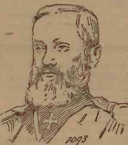
Ministrul de război al Rusiei. Actualmente a organizat marea manevră din Polonia, a cărora temă este aceea că o mare ostire atacă din spre Germania.