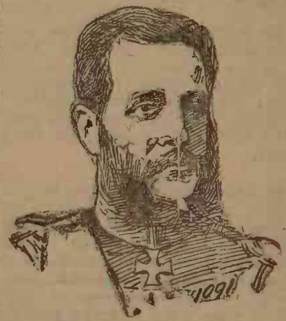
S'a născut la Petersburg la 10 Aprilie 1847. General de infanterie, comandant al circumscripției militare St. Petersburg...