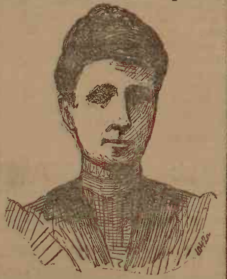
Maria Cristina, regina regentă a Spaniei. S'a născut la 9 Iulie 1858, ca arhiducesă de Austria.

Duce actualmente de fapt toate afacerile Spaniei. Femele energică, dar puțin aptă pentru locul primejdiuos pe care îl ocupă.