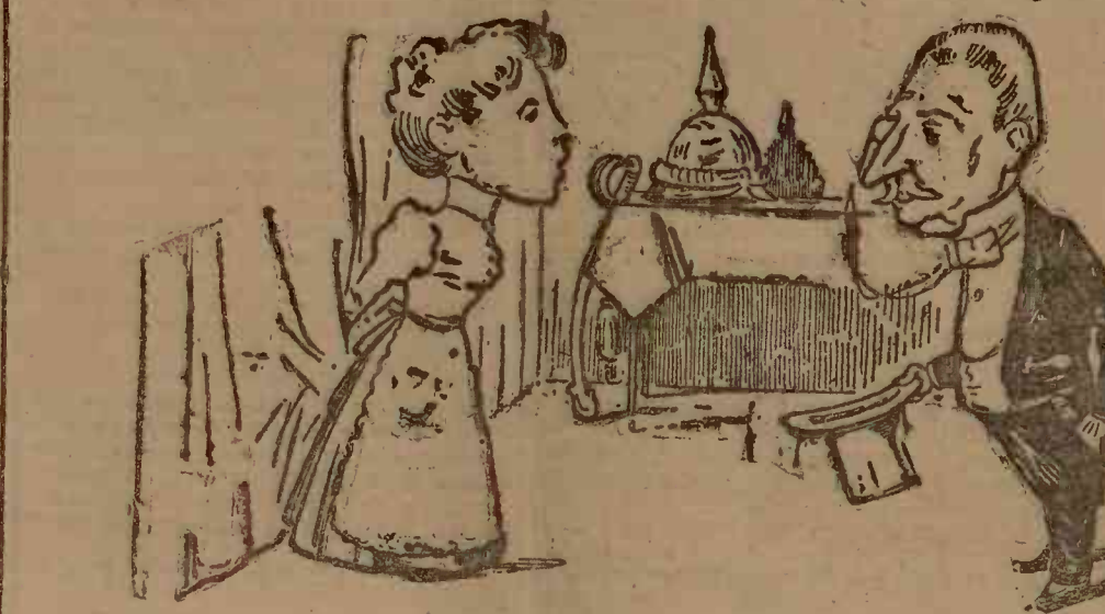
Felix Faure la Petersburg — Treceți mai tîrziu. Cine-va v'a luat înainte. (Aluziune la vizita împăratului Wilhelm, făcută înainte de venirea lui Faure).