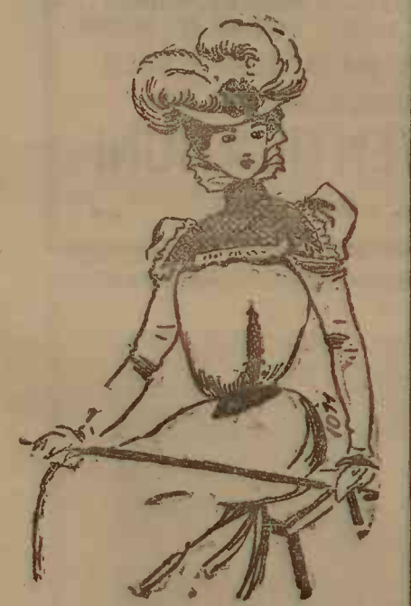
Rochie de stambă legeră, foarte simplă croită. Garnitură de guipură fină cremă, pe un transparent de tafeta aurie. Guler de gui,ură. Cravata și cingătoare de velur negru. Pălăria amazoană de pat alb cu două mari pone, și buf de velur negru, fixat printr-o agrafă de strass.