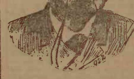
Cel mai talentat romanșier belgian care a putut trăduce în Franța unde are un mare succes ca autor naturalist și critic de artă.

A scris: Charniers, descrierea bătăliei de la Sedan, Un mâle, Concubins, Hysto-