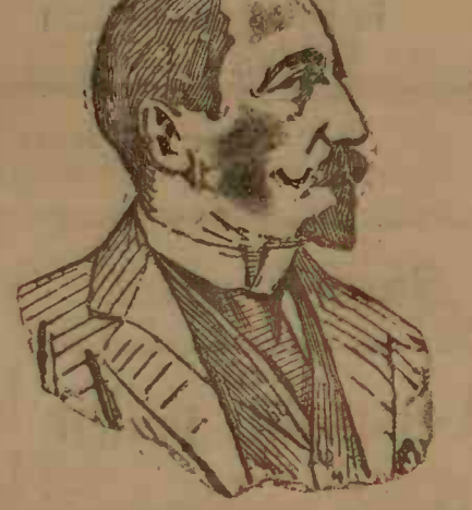
Fiul unui antiqvar din Paris, a debutat mai întîi în ziaristica colaborînd la diferitele ziare și reviste ca Vie litteraire, Le Globe, Les Debats, Le Journal officiel, Le Temps, unde a înlocuit pe Jules Claretie.

Camille Lemonnier este născut în 1835 și este foarte bine apreciat în Belgia, căreia dăduseu artit și a consacrat o parte bună din scrierile sale, mai ales asupra Flandrei.