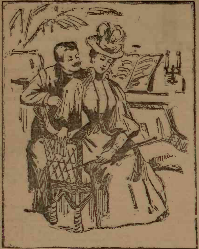
... Dar te asigur de sentimentele mele, de toată dragostea mea... sîni capabil de ori și ce. ... Afară ca să-mi dai bani să mă duc la băi.

găsese mai de loc — ba chiar de loc — oameni cari să scrie, să spuie, ce au văzut, să vire în capul oelor-laltă unele obiceiuri bune, unele lucruri practice. Poate că nu-l ar asculta nimeni pe cel care ar scrie în sfîrșit... s'ar vedea că a fost impresionat de ceva și că s'ar făcut o datorie să împărtășească și altora ce a văzut.