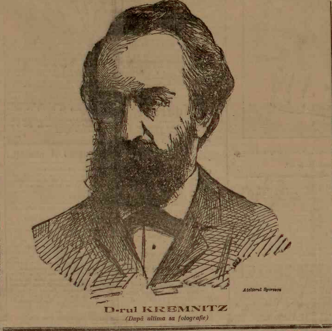
D-rul KREMNITZ (După ultima sa fotografie)

Ofițer de marină și academician, romanțier exotic al țării îndepărtate. S'a făcut cunoscut prin romanul său Les pecheurs d'Islande.