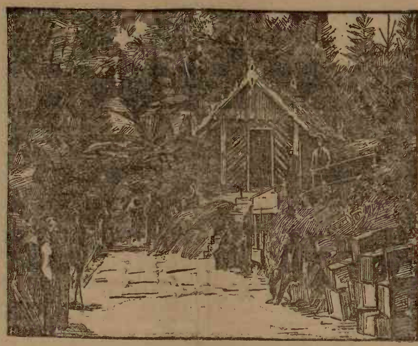
BĂILE SLĂNIC (Moldova)