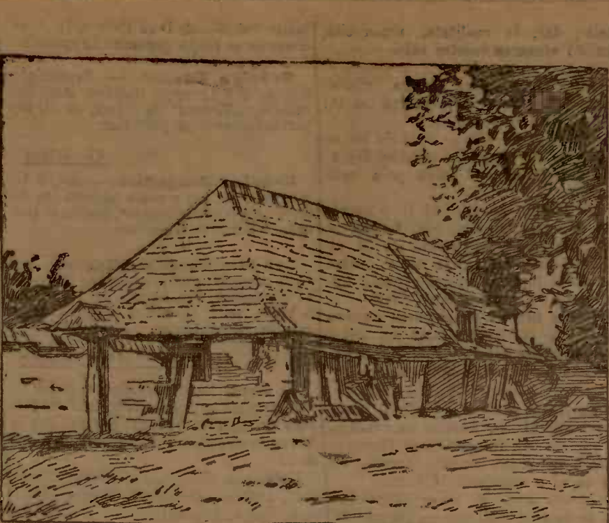
Ruinele casei unde s'a născut Andrei Mureșanu, în Bistrița

Jonathan s'apropie atunci de banditul care trăsese și care nu era altul de cît fratele lui Sam.