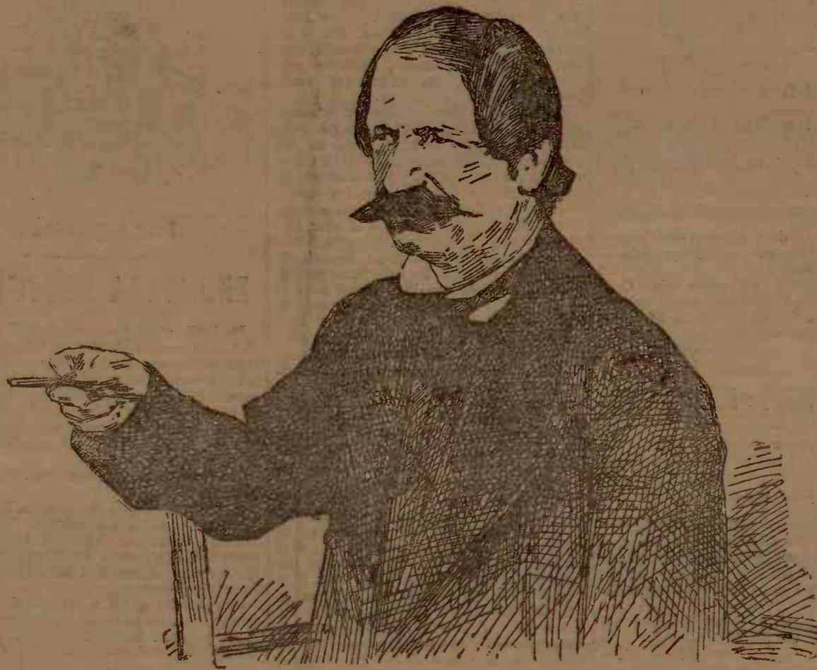
Avram Iancu Șeful mișcării din Ardeal

acum autorizația, cauza a fost că nu cunoștea regulamentul.