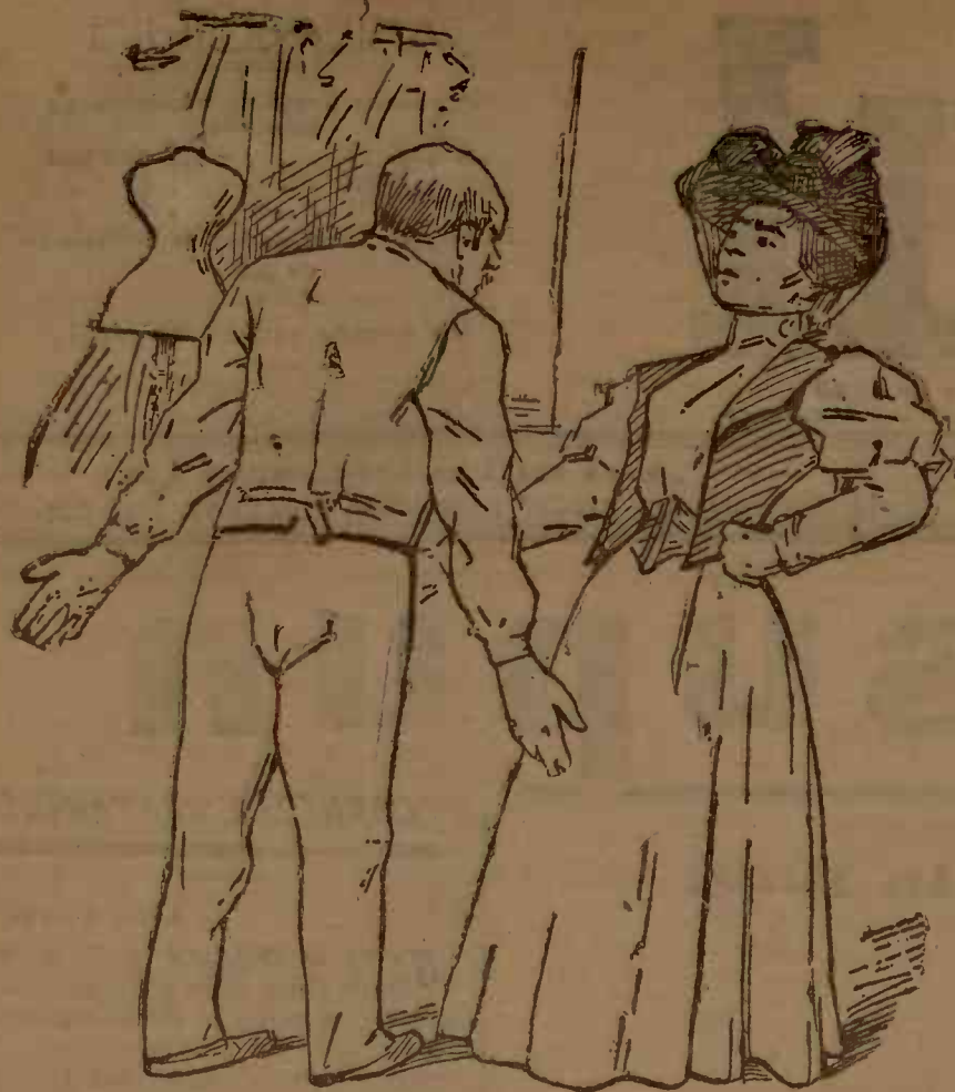
DOAMNA ȘI CROITORUL

Doamna. — Mi-ai făgăduit rochia pentru inundații și nici astăzi nu e gata! Noroc că Grozăveștii n'au fost inundați, alt-fel ce mă făceam fără rochie?