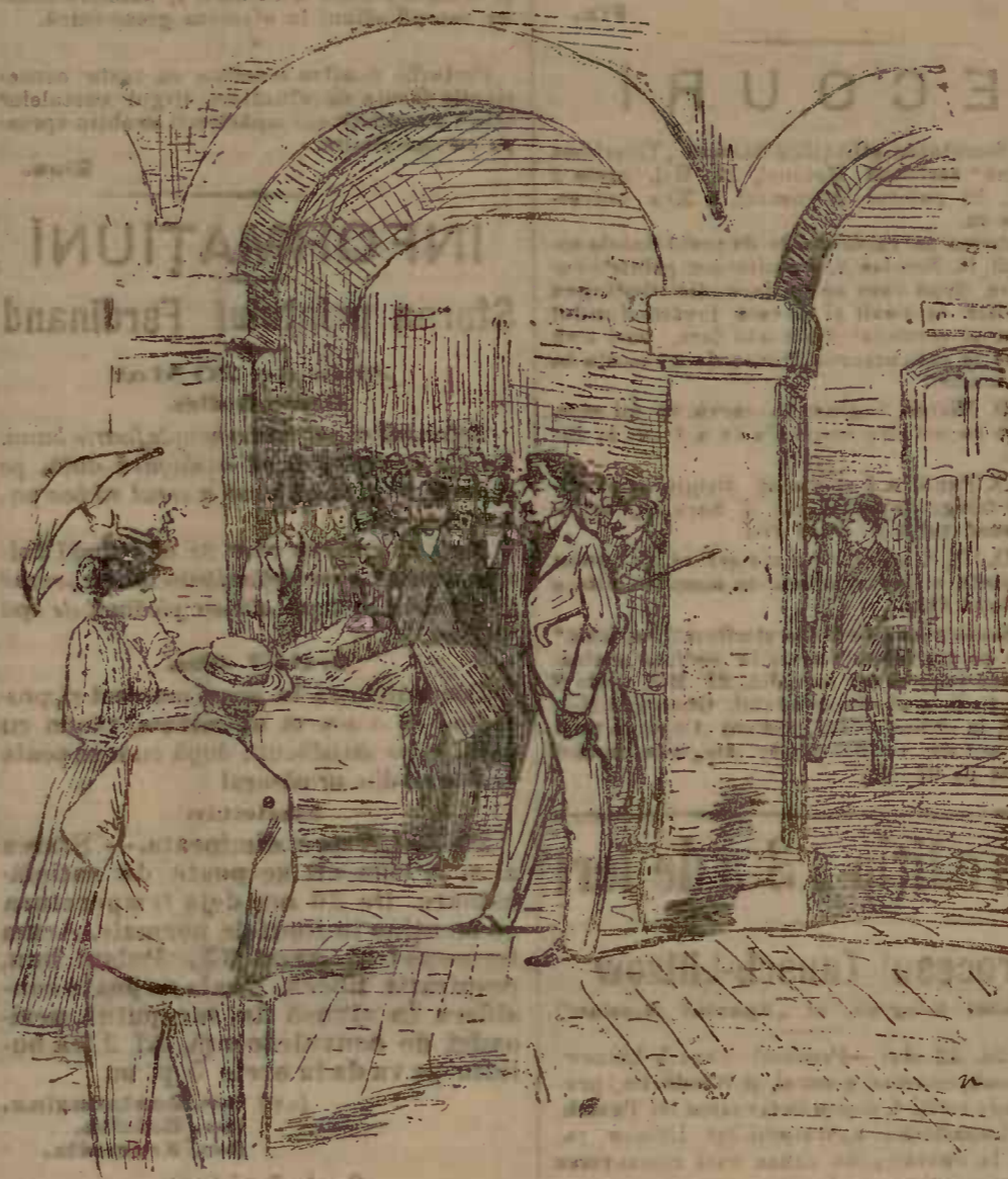
REGISTRELE DE ÎNSCRIERE — Schiță originală de D. N. Petrescu —