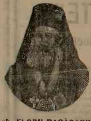
Arh. FLORU BĂCĂOANUL Noul episcop de Roman

Arhierul Ioanichie Bacăoanu a fost proclamat episcop al Romanului.