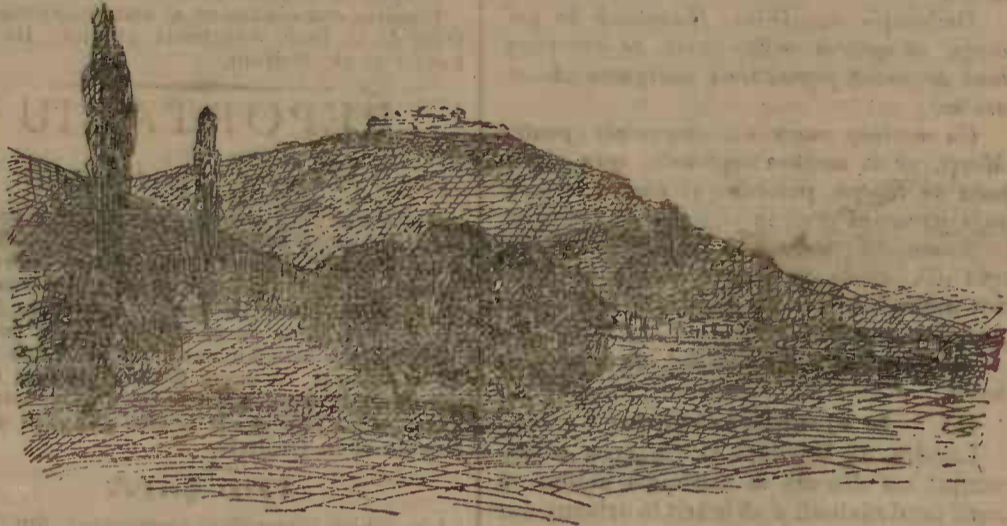
ARCADIA ȘI IMPREJURIMILE

are interes ca robia și absolutismul muscălesc să nu se întindă peste Prut și spre Balcani.