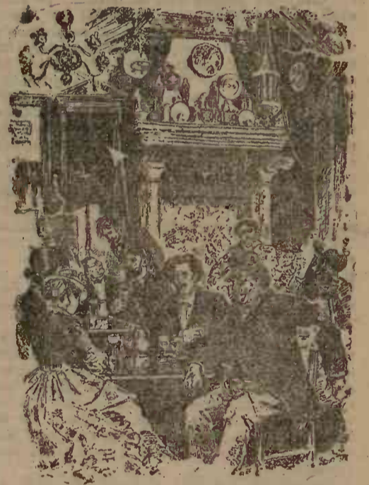
În interiorul circiumei