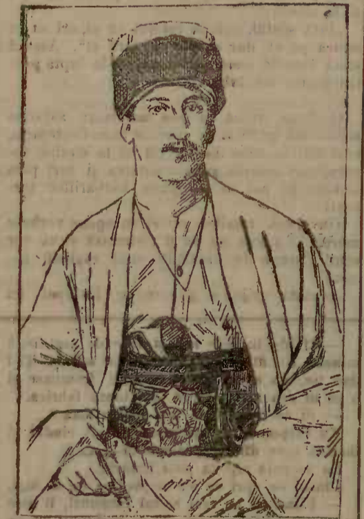
Deryiş din secta Beotasi