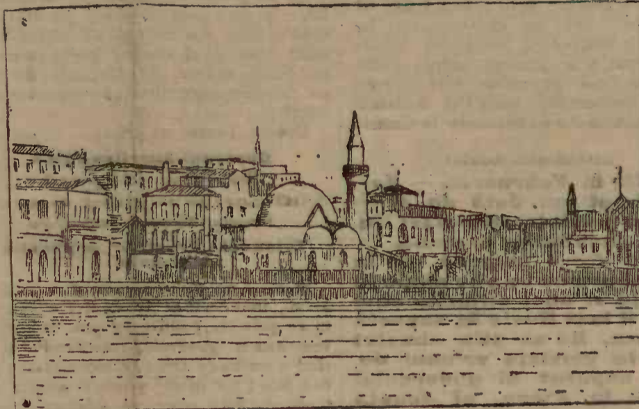
VAMA DIN CANEA