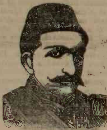
ABDUL-HAMID Suveranul Turcoiei