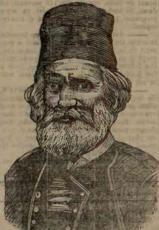
Președintele guvernului provizor din Creta. (prol mat l. 1896).