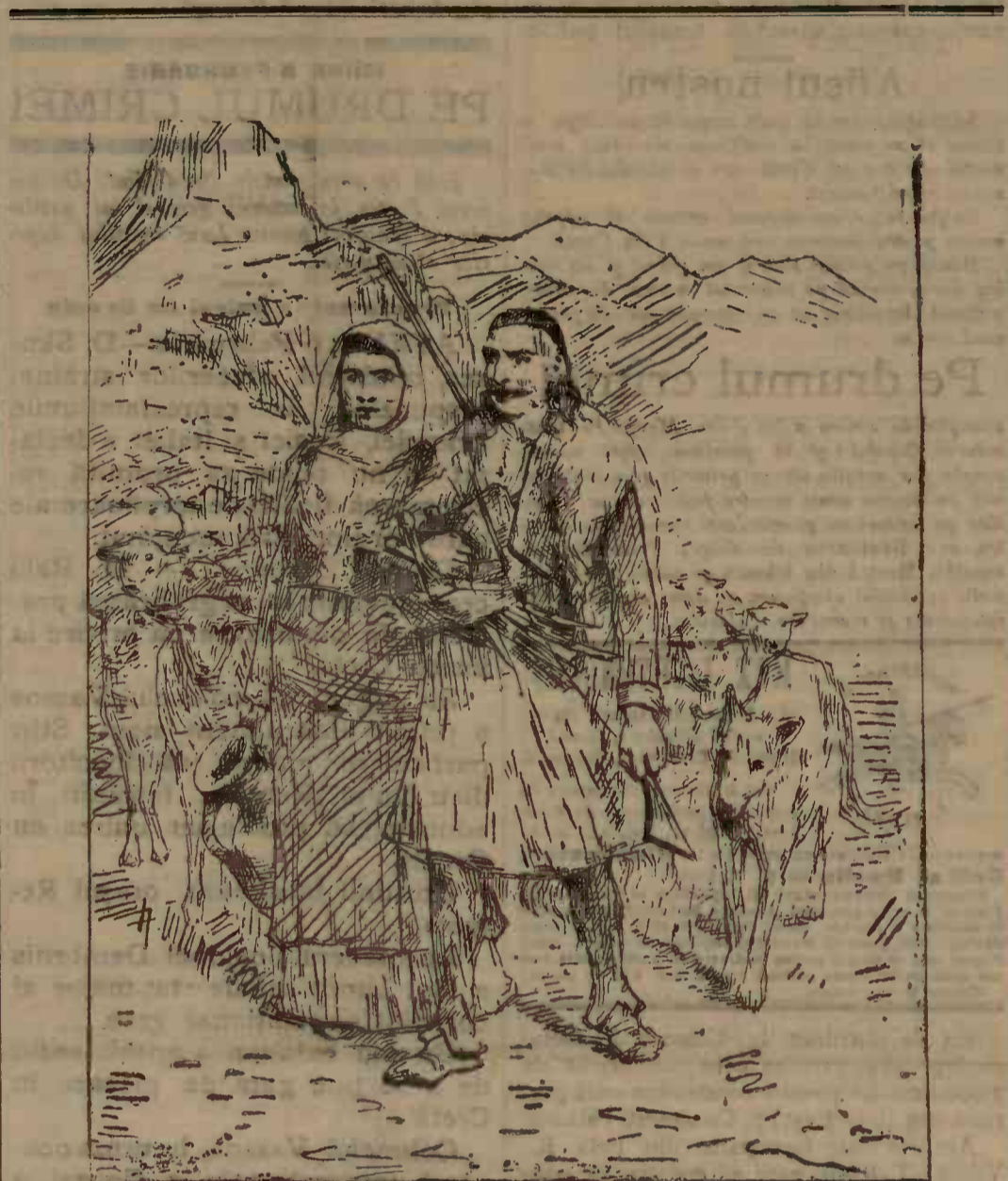
Tipuri din Creta

Și Germania a trimis un vapor de război la Creta. Comandantul vaporului german a primit de la im-