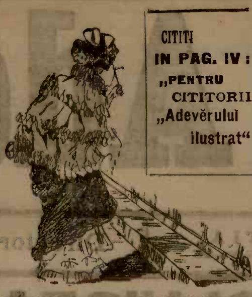
CITITI IN PAG. IV: „PENTRU CITITORII „Adevărului” ilustrat”

Nu se știe încă sigur dacă guvernul va anunța azi sau tocmai