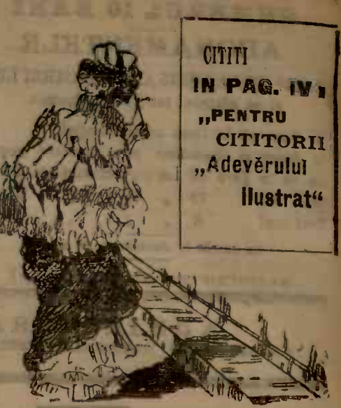
CITITI IN PAG. IV „PENTRU CITITORII „ADEVĂRULUI ILLUSTRAT“

D. Stolojan, care se știe că e partizan al D-lui Eug. Stătescu, spunea eri la Camera într'un grup de deputați, că soluția în chestia Ghenadie ar fi următoarea: