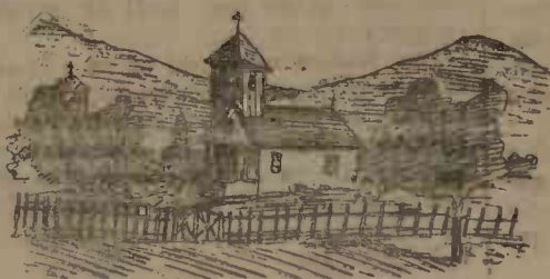
Biserica romînă din Viroioarova