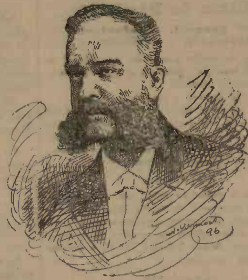
Contele Goluchowski Ministrul afacerilor streine