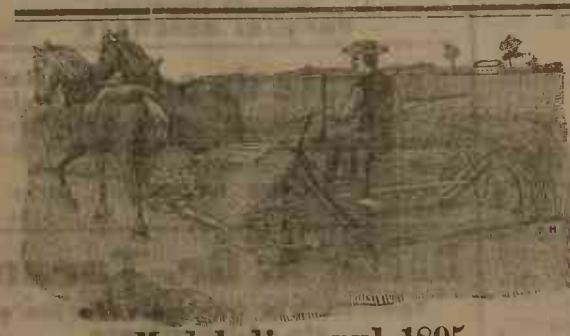
Model din anul 1895

Ultima perfecțiune, din fabrica JOHNSTON HARVESTER Co. Batavia (America)