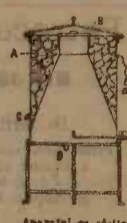
Aparatul cu rădător

FIE-CARE APARAT ESTE INZESTRAT CU CATE UNA INSTRUCȚIUNE SEMNATA DE D-nii D-rî A. BABEȘ