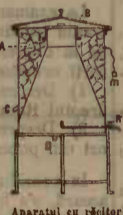
Aparatul cu rețier

FIE-CARE APARAT ESTE INZESTRAT CU CATE UNA INSTRUCȚIUNE SEMNATA DE D-nii D-ri A. BABEȘ