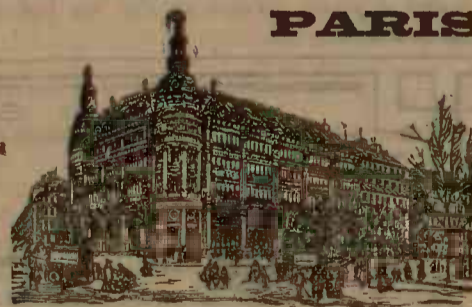
GRANDS MAGASINS DU

Loc separat d'asteptare pentru fie-care.