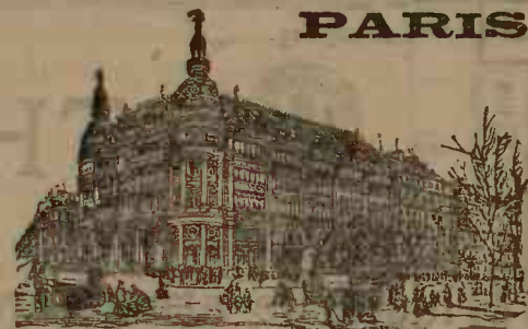
GRANDS MAGASINS DU