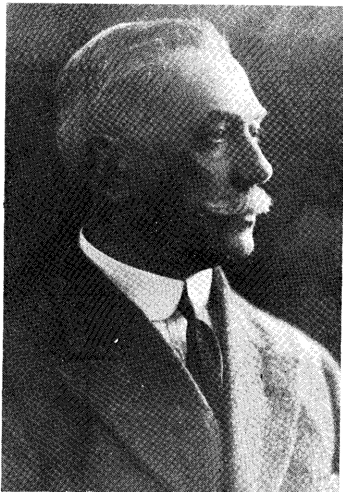
Liniștea de după furtună: un învingător obosit, în așteptarea „tregerii”: „De când am pierdut băiatul, nu mai văd nimic în viață...” (Muzeul literaturii române).

rîndu-se de insuccesele armatei noastre. Cugetul și inima mea sunt acolo unde e armata, și aș muri de o mie de ori mai bine decît să știu că triumfă părerea mea abstractă.