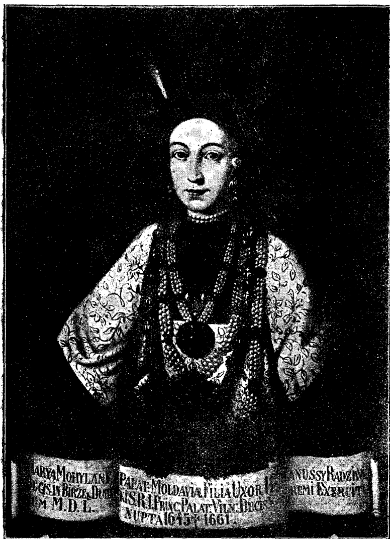
Maria, fiica lui V. Lupu căsătorită cu Ianusz Radziwil magnat lituan

mazilit de Turci, caută scăpare lângă domnul Moldovei, ca altă dată Nifon lângă Radu al IV-le al Munteniei. Domnul îi dă-