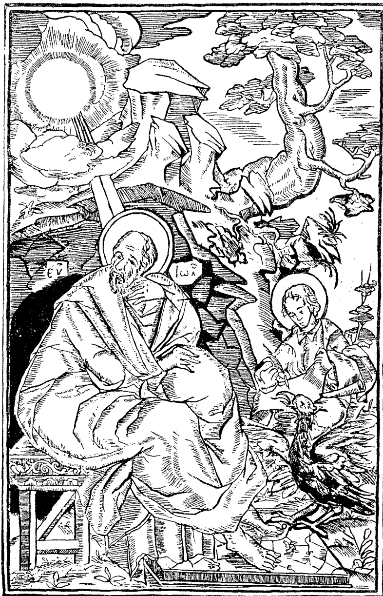
Sf. Ioan Evanghelistul, din Evanghelie , București, 1682