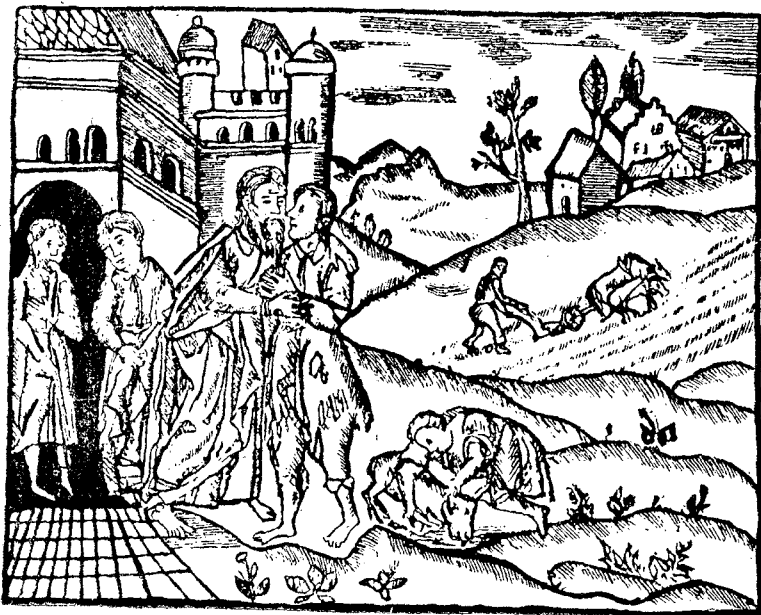
Frontispiciu din Carte românească, Iași 1643

E ușor de a dovedi că nu întâlnirea întâmplătoare a catehismului calvinesc între cărțile cele nouă, arătate de Udriște Năsturele mitropolitului Varlam, a determinat marele eveniment al introducerii limbei române în biserică. Anume nu avem de cât a cerceta data tipăriturilor de cărți românești , în ambele