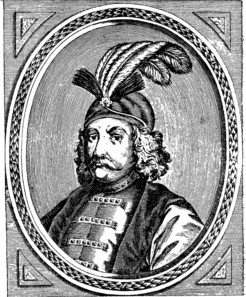
GOSTANTINO SERBANO PRINCIPE DI VALACCHIA &c.

Din momentul intronărei sale beiful trimise călărași pentru a o face cunoscută în toată țara, și în curs de 40 de zile vedem