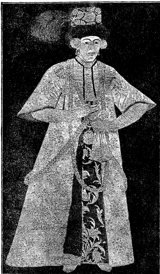
Tudosca Doamna lui Vasile Lupu