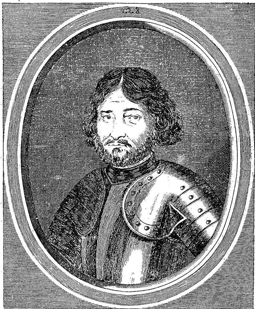
GIOVANNI GREGORIO GIKÀ PRINCIPE DI VALACCHIA

încetă; ciurma se stinse, datorile începură a se plăti și poporul începu a răsufli 90 .