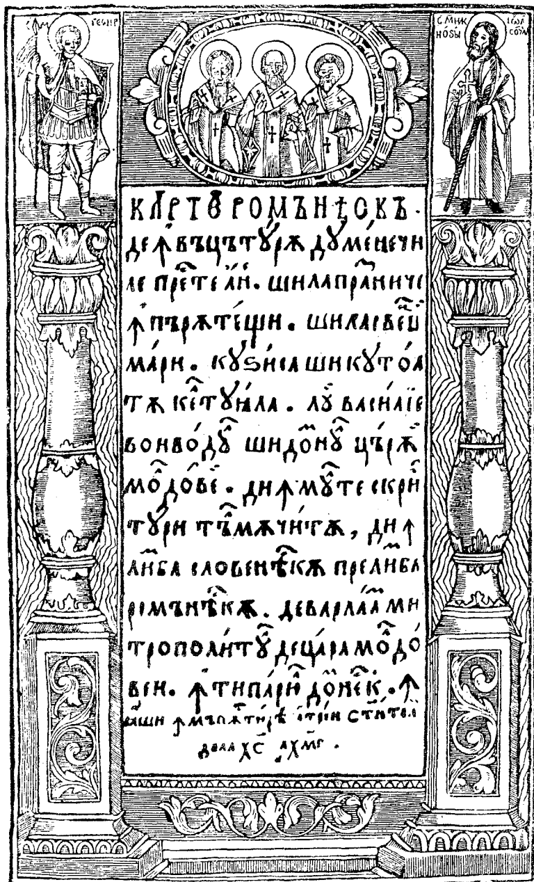
Titlul la Carte românească de învățătură [Cazania lui Varlaam], Iași, 1643