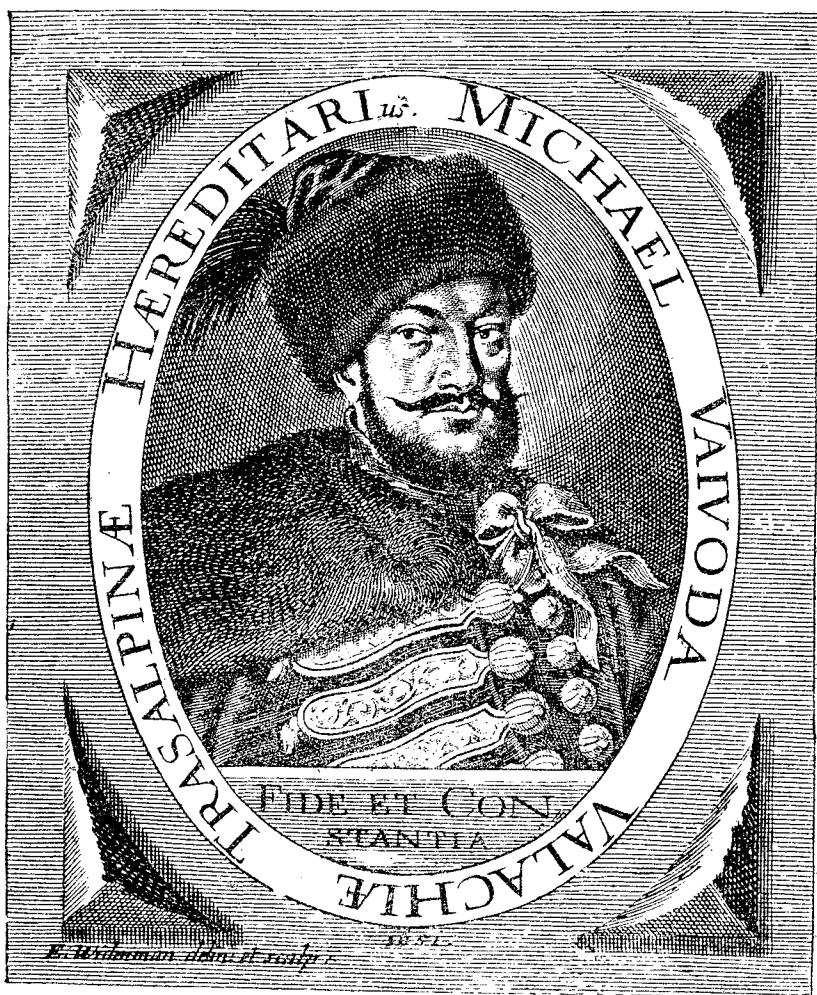
Mihnea al III-lea

și a cheltuit la Poartă, va căuta să o scoată din biata Muntenie cu dobândă și încincit 25 ; că în deobște ei nu pot primi în nici