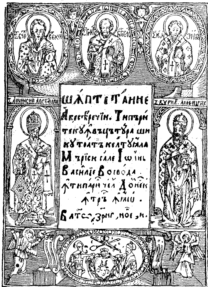
Șapte taine, 1644

între altele pe timpul lui Matei Basarab și Pravila cea Mare sau Indreptarea Legii în 1652.