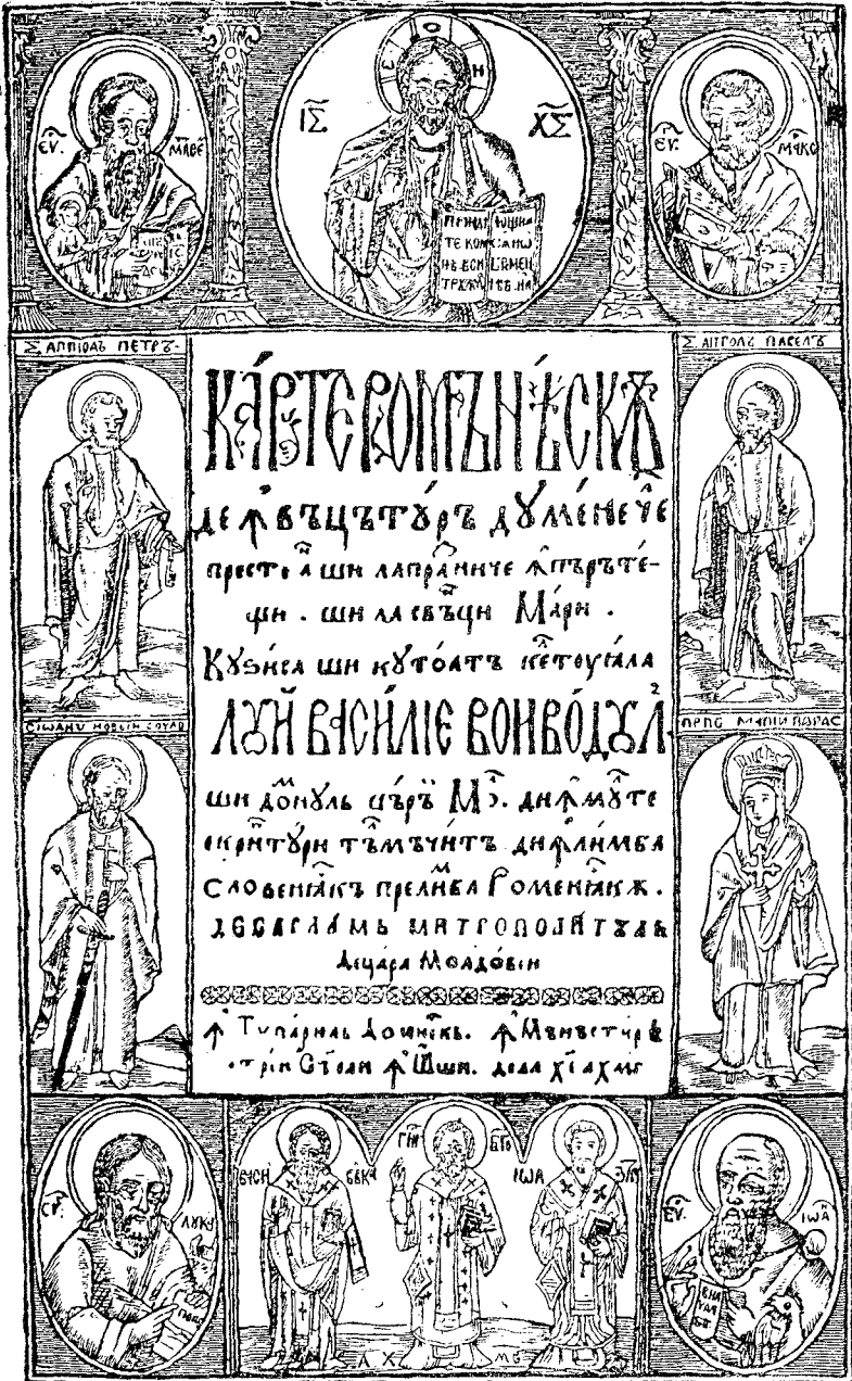
Titlul la Carte românească de învățătură [Cazania lui Varlaam], Iași, 1643