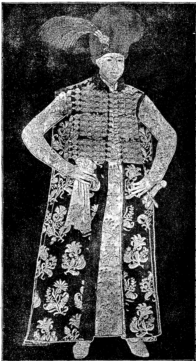
Ion Vodă, fiul lui Vasile Lupu