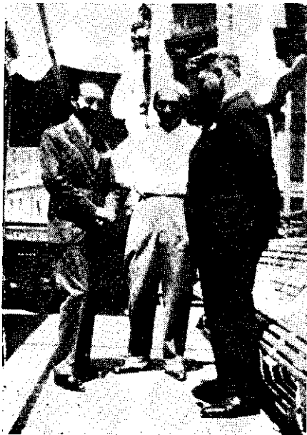
Ionel Teodoreanu, Mihail Sadoveanu și Teodor Scorțescu.

10 Parcă toți își uitaseră profesiile, itinerariile urbane, ticurile și vocabularul de odinioară. Parcă toți se mirau mai mult decât se bucurau că nu maibubue tunul. Și ziarele fără „comunicate” păreau fade, și asasinatele în bandă fapte prea mărunț diverse ca să merite publicitatea tiparului. Domnea încă nevoia isterică de „evenimente”, care dădeau un aer de blazare tuturor în viața cotidiană. Parcă ar fi dorit toți încă o catastrofă, care le făcea în ciudă și nu mai venea, lăsându-i să trăiască pur și simplu în noul constipat al atmosferei zilnice.