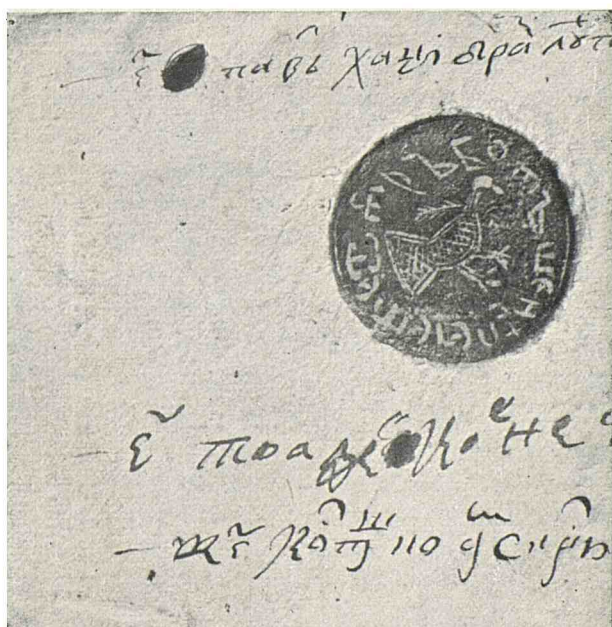
Trei peceti nouă, din secolul al XVIII-lea, ale orașului Botoșani.