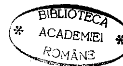
TABLA DE MATERIE