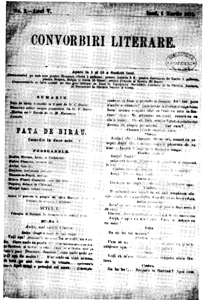
Inceputul comediei Fata de birău (Convorbiri literare, nr. 1 din 1 martie 1871)